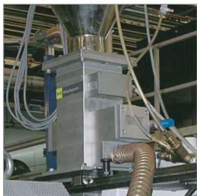
射出成形機に取り付けられたPROTECTOR

プラスチックの加工工程において、小さな金属片は、射出成形機、押出機、ブロー成形機に高額なトラブルを引き起こします。特に、再生原料を使用する場合は、トラブルのリスクが増加します。そして、ノズル、フィルタ、チャネルシステムの詰りが発生し、ダウンタイムと納期遅れを引き起こします。金属選別機PROTECTORは、射出成形機、押出機、ブロー成形機の投入口に、直接取り付けます。磁性金属と非磁性金属(鉄、ステンレス、アルミ等)を検出します。(たとえ金属がワーク内に入り込んでいても)金属混入は、“クイックフラップ”選別機で排出されます。